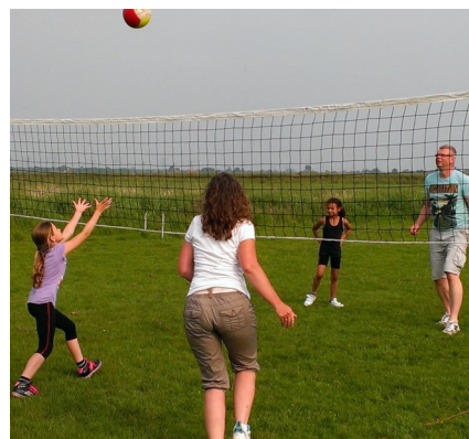
Ouder-kind toernooi 2014

Tijdens de basisschoolvakantie zijn er geen trainingen. Het seizoen loopt door tot eind mei.